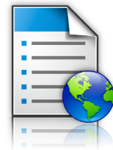
Formularios y favoritos

Las capacidades de soluciones de la serie se combinan con herramientas de gestión de flota de Lexmark, el software empresarial existente y la infraestructura técnica para conformar el ecosistema MFP inteligente de Lexmark. Su adaptabilidad protege a futuro su inversión en tecnología de Lexmark.